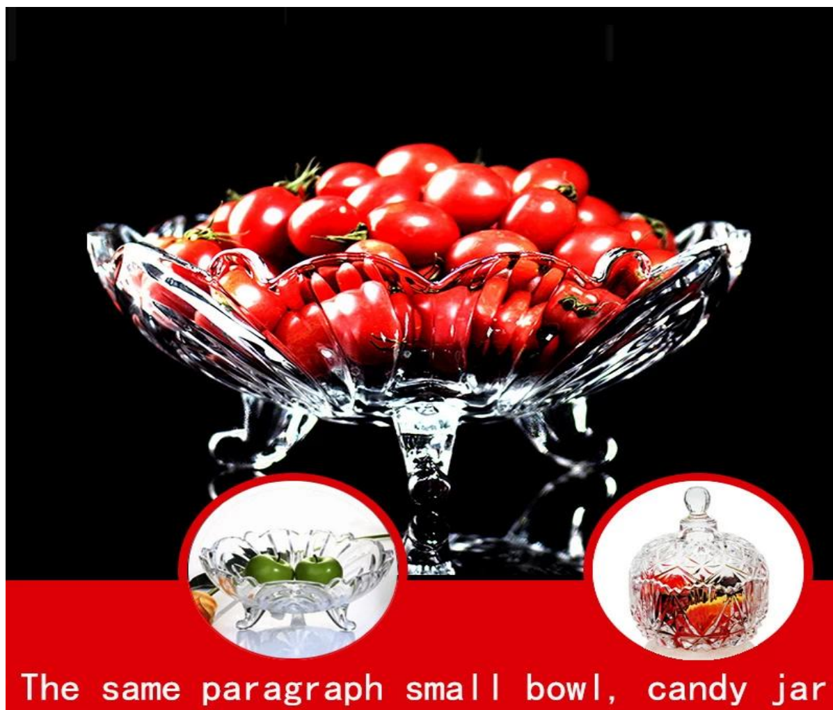
The same paragraph small bowl, candy jar