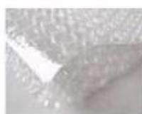
C. Bubble paper