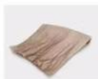
B. Corrugated paper