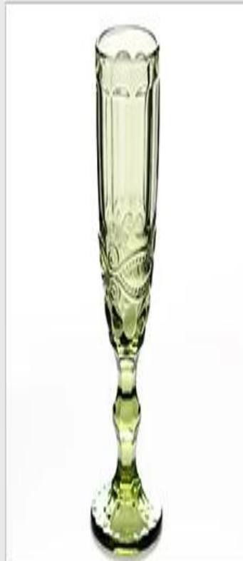
pattern - green

Quais são as aplicações coloridas taças de champanhe vidro?