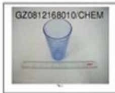
SGS Reference for this report: 160424-010 17 Oct 2014