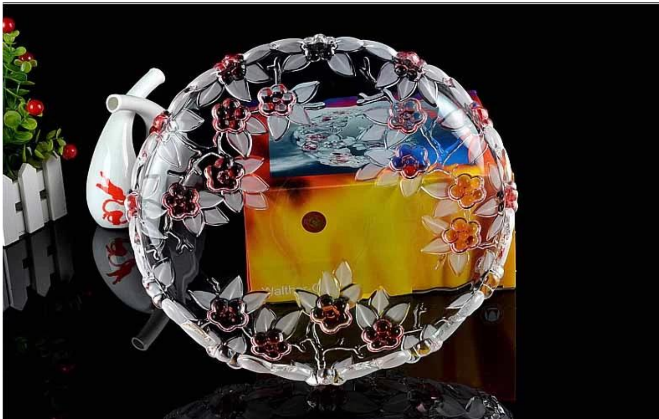
Thuis glas fruit emmer foto's: