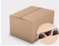
F. Three layer Corrugated paper master carton