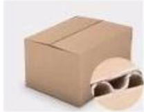
F. Three layer Corrugated paper master carton