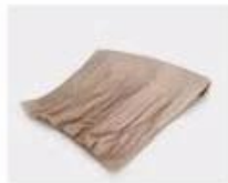
B. Corrugated paper