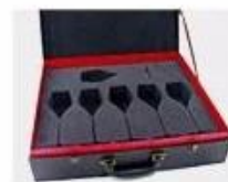
N. Gift Box