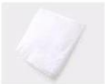
A. White paper