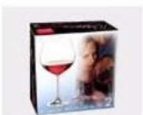
K. Color Box