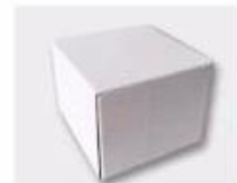
J. White Box