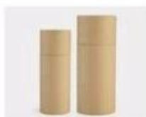
L. Paper Sleeve