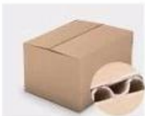
F. Three layer Corrugated paper master carton