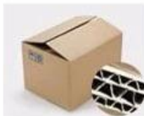
H. Seven layer Corrugated paper master carton