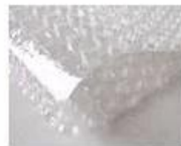
C. Bubble paper