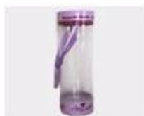
M. Pvc Box