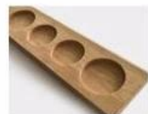
R. Wooden Pallet