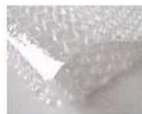
C. Bubble paper