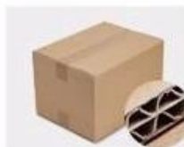
G. Five layer Corrugated paper master carton