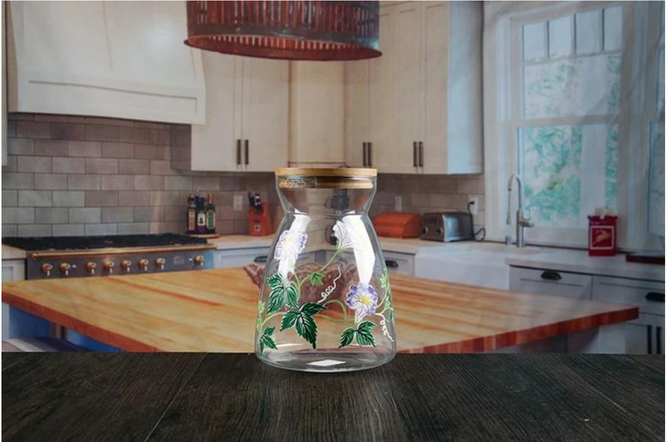
Foto di capacità vetro barattoli con coperchi di legno di grandi dimensioni: