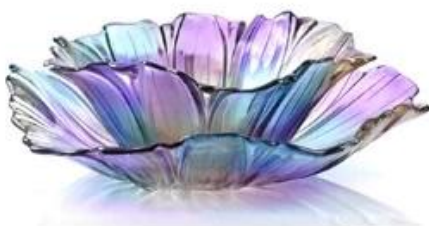
【 Bright 】