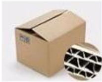
H. Seven layer Corrugated paper master carton