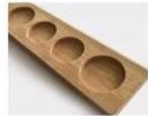
R. Wooden Pallet