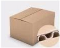
F. Three layer Corrugated paper master carton