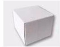
J. White Box