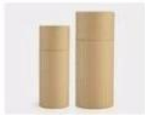
L. Paper Sleeve