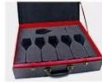
N. Gift Box