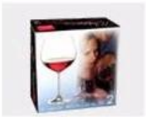
K. Color Box