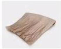
B. Corrugated paper