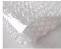
C. Bubble paper