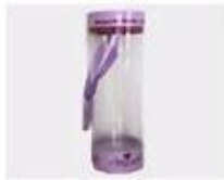
M. Pvc Box