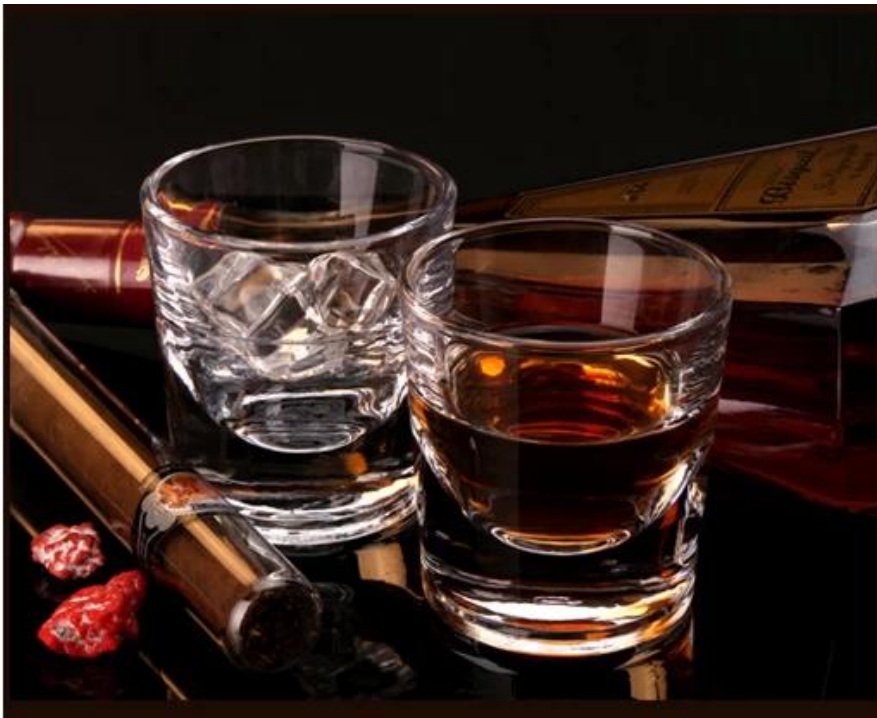
Whisky glass 9