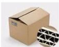
H. Seven layer Corrugated paper master carton