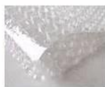
C. Bubble paper