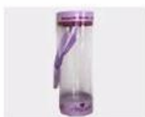
M. Pvc Box