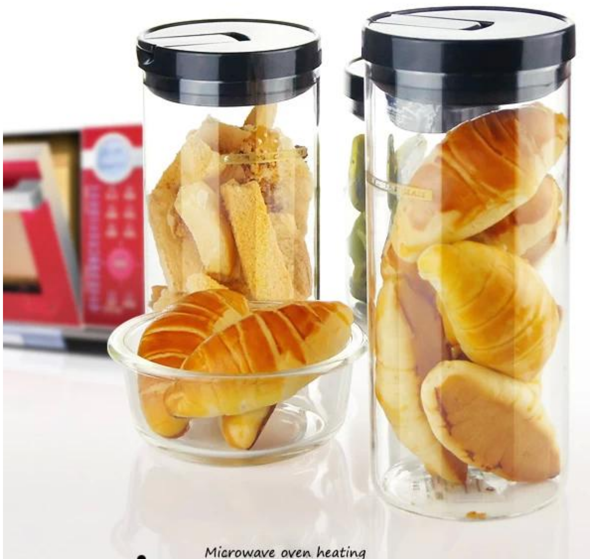
Microwave oven heating