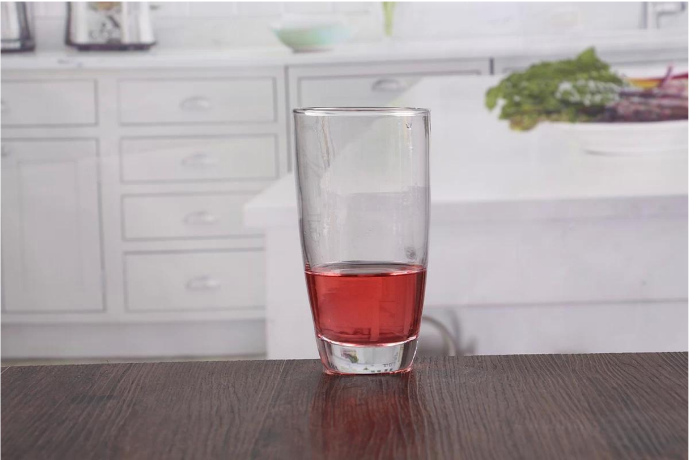
مجموعات الزجاج الشرب